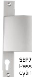
SEP776 Passage cylindre européen