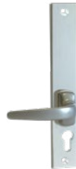
Solution B Béquille sortie libre Uniquement pour les modèles 2022