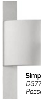
Simple DG771 sans Passage de cylindre

Chaque poignée est disponible en version droite et gauche.