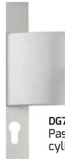
DG771 Passage cylindre européen