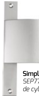
Simple SEP776 sans passage de cylindre