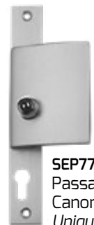
SEP778 Passage cylindre européen Canon poussoir Uniquement sur la SEP77