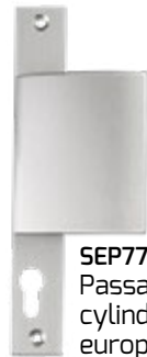
SEP776 Passage cylindre européen