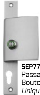
SEP7702 Passage cylindre européen Bouton électrique Uniquement sur la SEP770