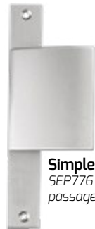
Simple SEP776 sans passage de cylindre