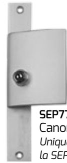
SEP777 Canon poussoir Uniquement sur la SEP77