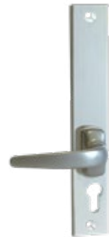
Solution B Béquille sortie libre