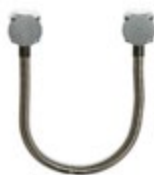
Flexible diamètre intérieur 9m FM30AS1